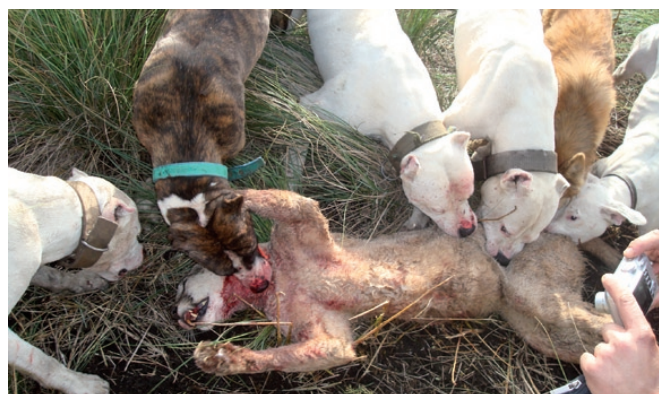
Figura 5. Una escena impactante: cazadores con jauría son contratados por estancieros para perseguir al puma. Con esta modalidad un número considerable de pumas habrían muerto en los años 2008 y 2009 en el sudeste de Córdoba