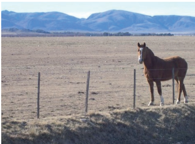
Figura 10. La población serrana de pumas puede estar aislada. Fuera del cordón de sierras la ocurrencia de la especie es ocasional.