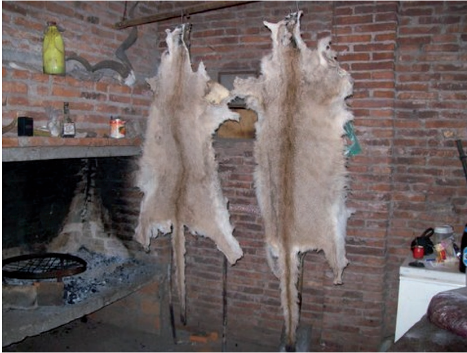
Figura 8. Cueros de pumas en un galpón de cazadores furtivos en el Sistema de Ventania. La caza oportunista de la especie es una amenaza potencial para esta población fragmentada.