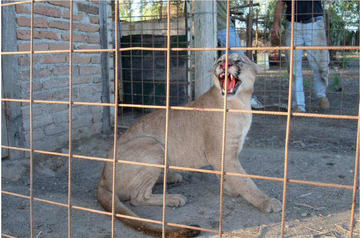
Figura 6. Otra foto del puma capturado a orillas del Río Cuarto en su intersección con la antigua ruta nacional 8 (Córdoba).