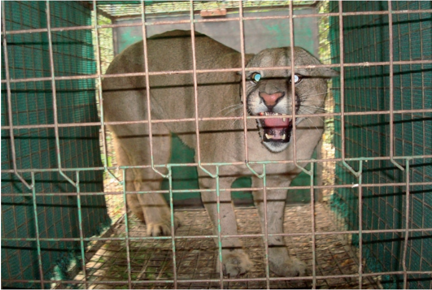
Figura 2. Puma capturado con jaula trampa a orillas del Río Cuarto en cercanías de La Carlota, Córdoba.