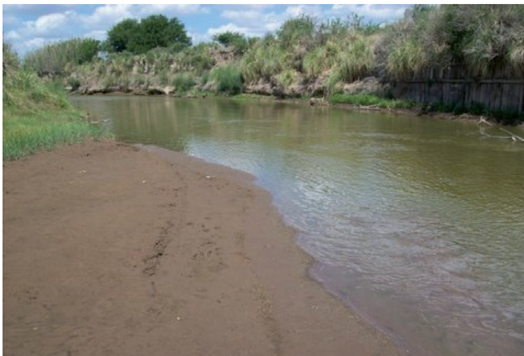
Figura 11. Río Cuarto. Supuesto corredor de dispersión utilizado por pumas. En algunos establecimientos se cultiva hasta las márgenes de los ríos y arroyos lo que puede estar afectando la conectividad entre subpoblaciones de pumas.