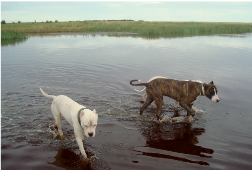
Figura 3. Estancia lindera a la Reserva Privada “Laguna La Chanchera” parte del Sistema de Lagunas del Sur de Córdoba.