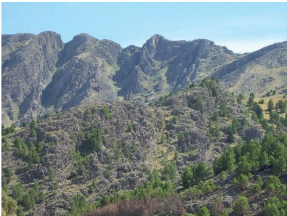
Figura 7. Cerro Ventana en el Parque Provincial Ernesto Tornquist. Las 6.500 ha de este Parque constituyen la única superficie con protección formal en el Sistema de Ventania.