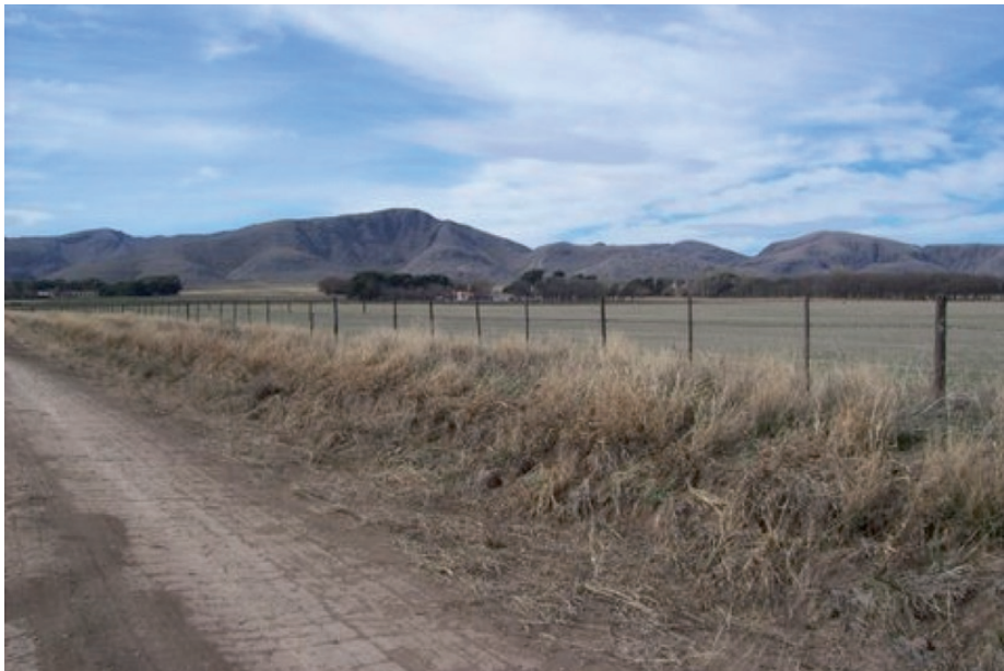
Figura 9. Estancia Curacó en las Sierras de Curá Malal (partido de Saavedra). Un establecimiento donde las pérdidas ocasionadas por pumas son percibidas como muy importantes y donde la especie es considerada plaga. Los ataques se centran principalmente sobre ovinos.